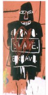
Détail de : Jean-Michel Basquiat, The Nile , 1983. Acrylique et pastel gras sur toile, montée sur châssis de bois, 172,5 x 358 cm. Collection particulière.