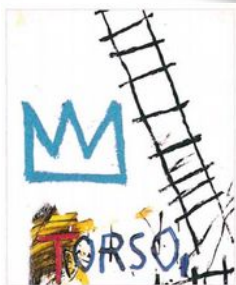
Détail de : Jean-Michel Basquiat, Leonardo da Vinci's Greatest Hits , 1982. Acrylique, pastel gras et papier collé sur toile, 213,4 x 198 cm. The Schorr Family collection ; en dépôt au Princeton University Art Museum.