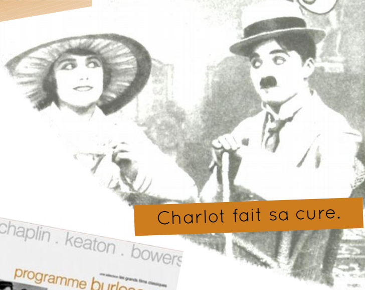
Charlot fait sa cure.

Notre classe est inscrite au dispositif École & Cinéma. Nous découvrirons trois films, un par trimestre, au cinéma Hélios, de Colombes. Ce dispositif d'éducation au cinéma national associe le Ministère de l'éducation nationale, le Ministère de la culture et de la communication et les collectivités territoriales (Ville de Colombes).