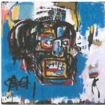
Jean-Michel Basquiat. Untitled 1982 ©Estate of Jean-Michel Basquiat. Licensed by Artstar, New York.

BILLET UNIQUE VALABLE POUR LES 2 EXPOSITIONS EGON SCHIELE JEAN-MICHEL BASQUIAT