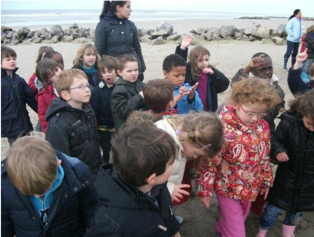
Les GS à la plage