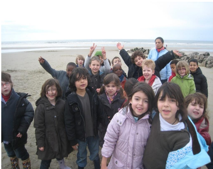
Le cp d à la plage