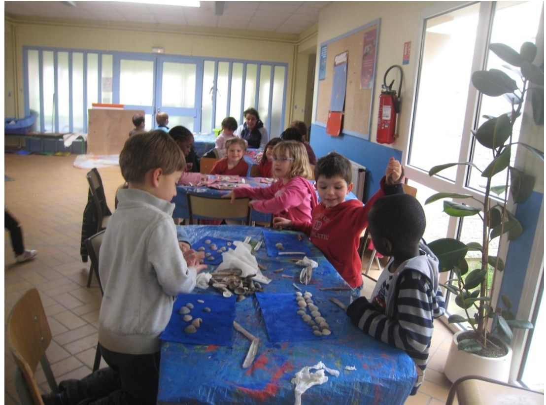
Réalisation de nos chefs d'œuvre