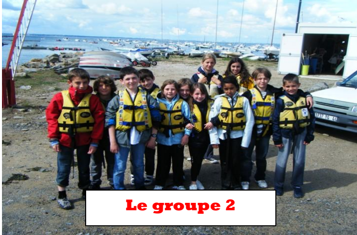
Le groupe 2

Journal des CM2B de l'école Lazare Carnot en classe de mer à Sainte Marie Sur Mer, du 7 au 21 juin 2010