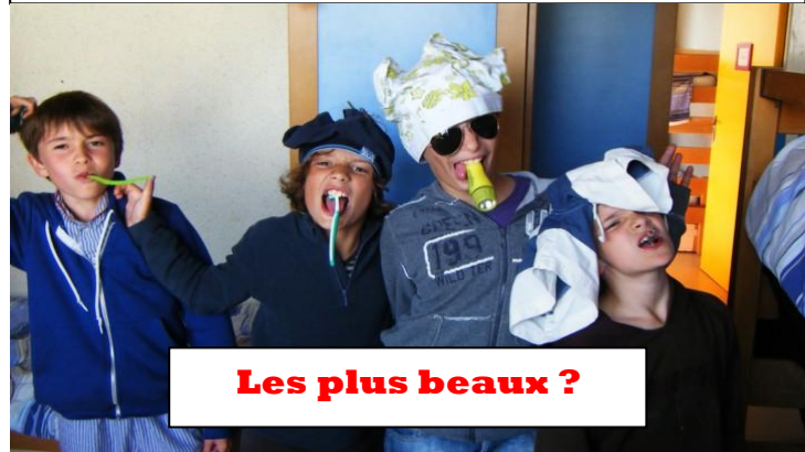
Les plus beaux ?

Un jeu dans lequel il y a trois camps (les poules, les renards et les vipères). Les poules mangent les vipères, les vipères mangent les renards et les renards les vipères. Drôle de chaîne alimentaire !