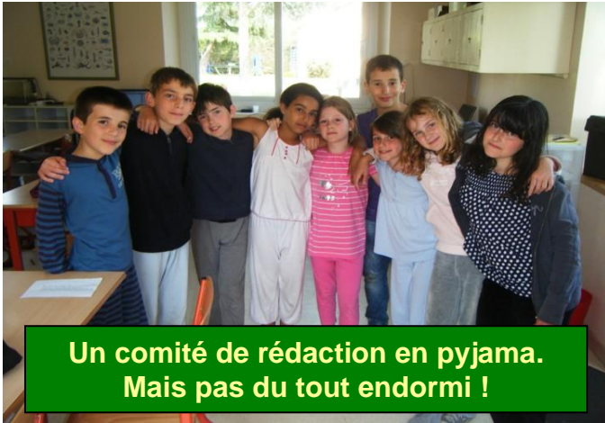
Un comité de rédaction en pyjama. Mais pas du tout endormi !

Journal des CM2B de l'école Lazare Carnot en classe de mer à Sainte Marie Sur Mer, du 7 au 21 juin 2010