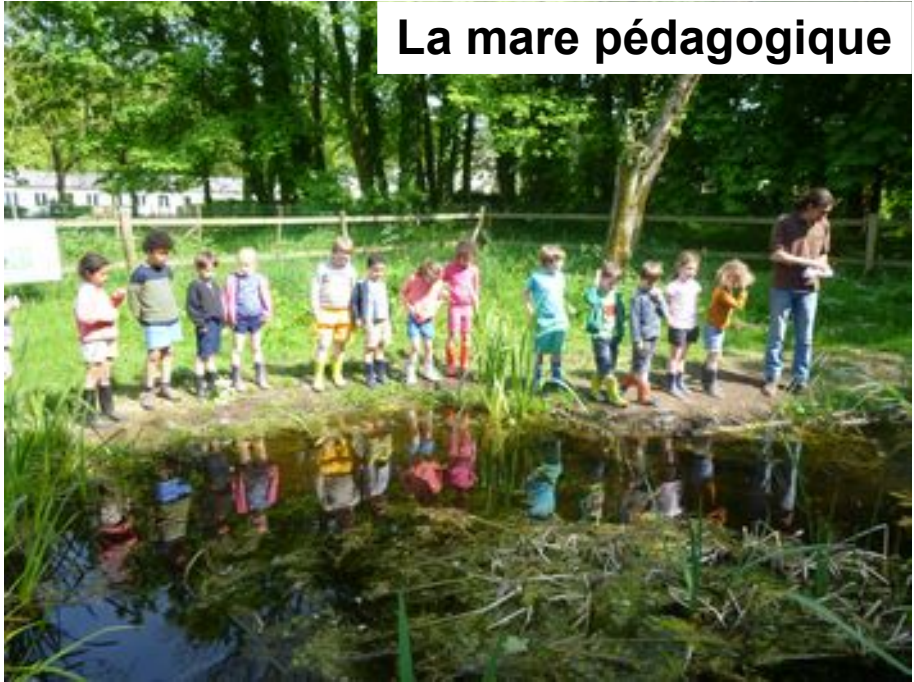
La mare pédagogique