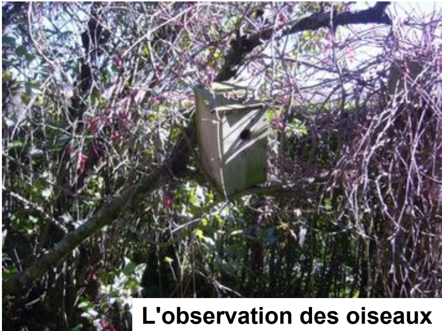
L'observation des oiseaux