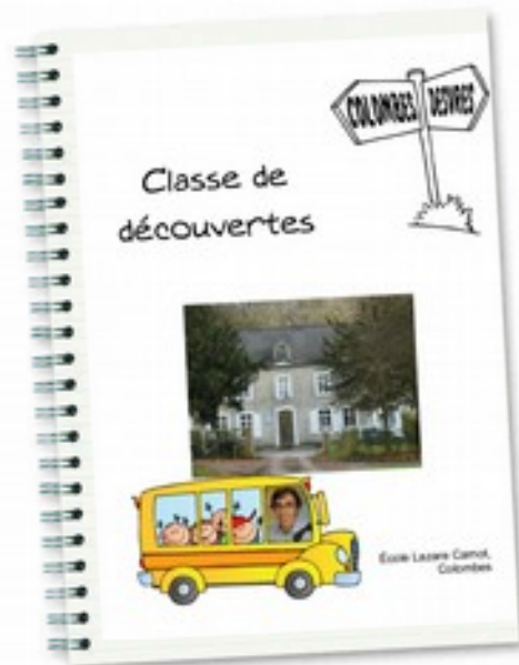
← Le carnet de bord