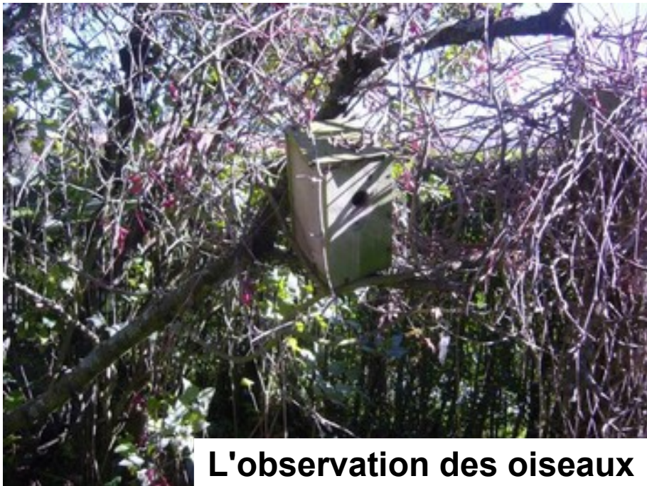
L'observation des oiseaux