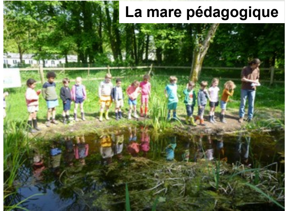
La mare pédagogique