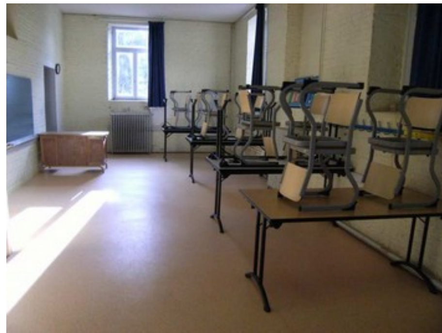
la salle de classe