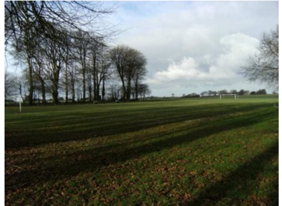
Emplacement feu de camp