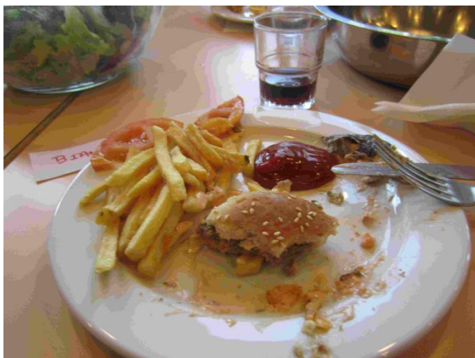
Le repas de la soirée boum