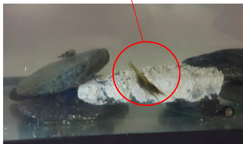
Voici une crevette !

Nous avons rapporté des crevettes, deux ophiures, deux crabes, deux gobies, une étoile de mer et quelques bigorneaux.